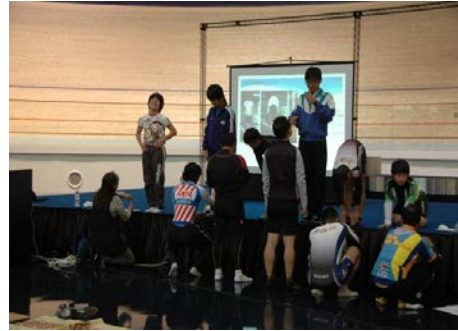
トレーニング専門家による講義