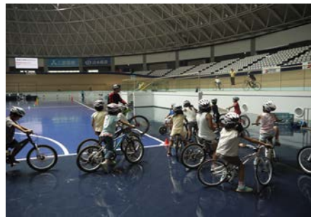
木製トラックを試走